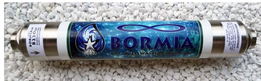
Bild ist äußerlich baugleich mit allen Hausanlagen

Lebendiges Wasser zum Trinken, Baden, Duschen, Kochen, Waschen, Garten...